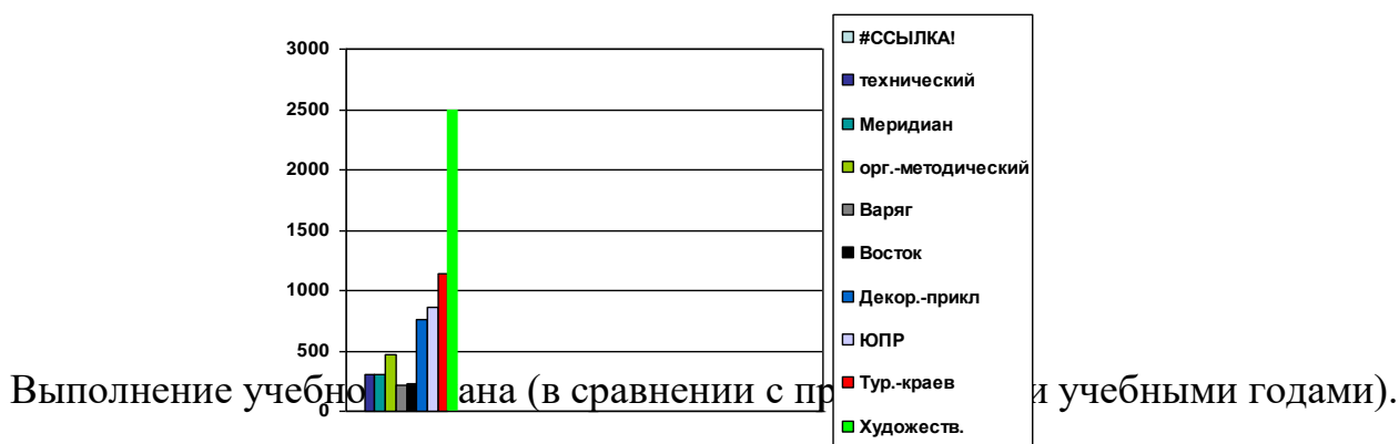
Количество детей на конец 2016-2017 учебного года по отделам

На базе общеобразовательных учреждений работают коллективы: танцевальные ансамбли «Витаминки»; «Kid style»; «Премьера»; театральная студия «Рампа», фольклорный коллектив «Сударушка»; вокальные ансамбли «Школьные годы» и «Аллегро», объединение «Гитара», кружки экологической, краеведческой, туристской, альпинистской направленности, кружки по спортивному ориентированию.